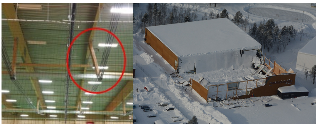
Figur 1. Till vänster en bild tagen strax före raset. Notera den markerade snedställda trycksträvan. Till höger Tarfalahallen två dagar efter raset. Bild till vänster från vittnet, bild till höger från Polisen. Bilderna får spridas vidare med information om ursprunget.

Tarfalahallen hade en takkonstruktion med underspända raka takbalkar. En av personerna som befann sig i hallen vid raset lyckades fotografera en deformerad takstol strax före raset.