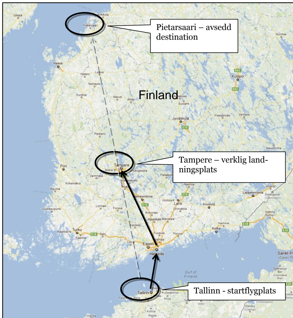
Figur 2. Karta över området.