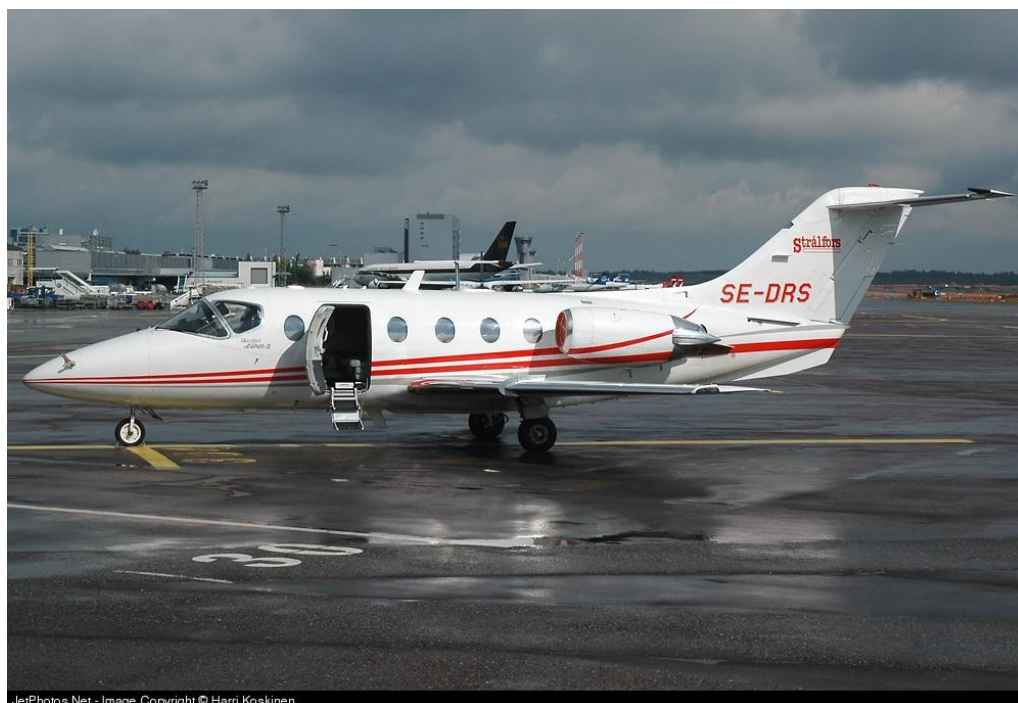
Figur 1. Beech 400A.

Varningen indikerade att de två sensorerna som känner av de horisontella komponenterna i jordens magnetfält gav olika signaler. De två kompassindikeringsarna visade enligt uppgift upp till 180° skillnad. Avvikelsen mot reservkompassen var upp till 90°. Dessa problem kan uppstå där det finns störningar i det omgivande jordmagnetfältet, t.ex. beroende på järnföremål i marken under kompassen. I det aktuella fallet misstänkte befälhavaren att problemen berodde på att de magnetiska kompasserna blev störda av armeringsjärn i taxibanans betongunderlag.