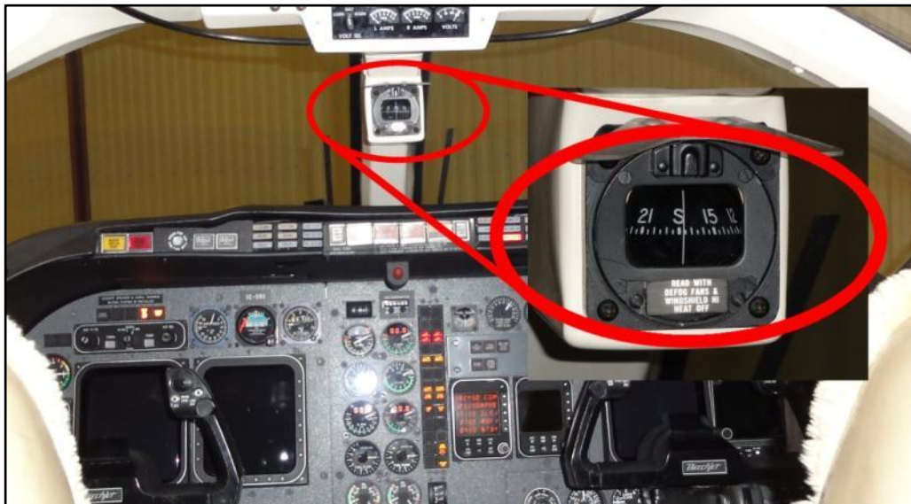
Figur 5. Reservkompass.