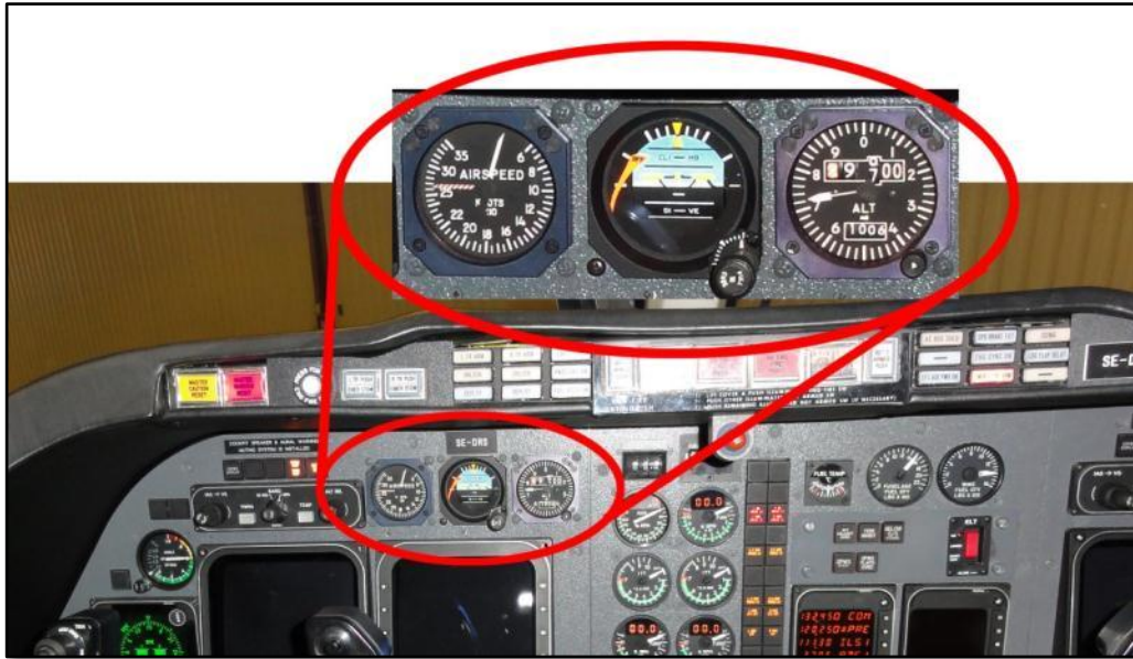
Figur 4. Reservinstrument.

Däremot fanns lokal radar på Tampere-Pirkkala flygplats som möjliggjorde en PAR 10 -inflygning. Besättningen begärde därför tillstånd att landa i Tampere och planerade för en PAR-inflygning. Inflygning och radarledning fullföljdes med hjälp av reservinstrumenten och luftfartyget landade på Tampere-Pirkkala flygplats utan ytterligare problem.