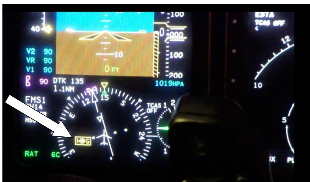
Figur 3. Kursvarning.