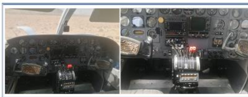
Etat du poste de pilotage □