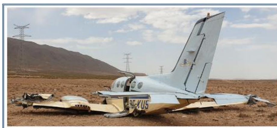
Etat de l'avion après l'accident